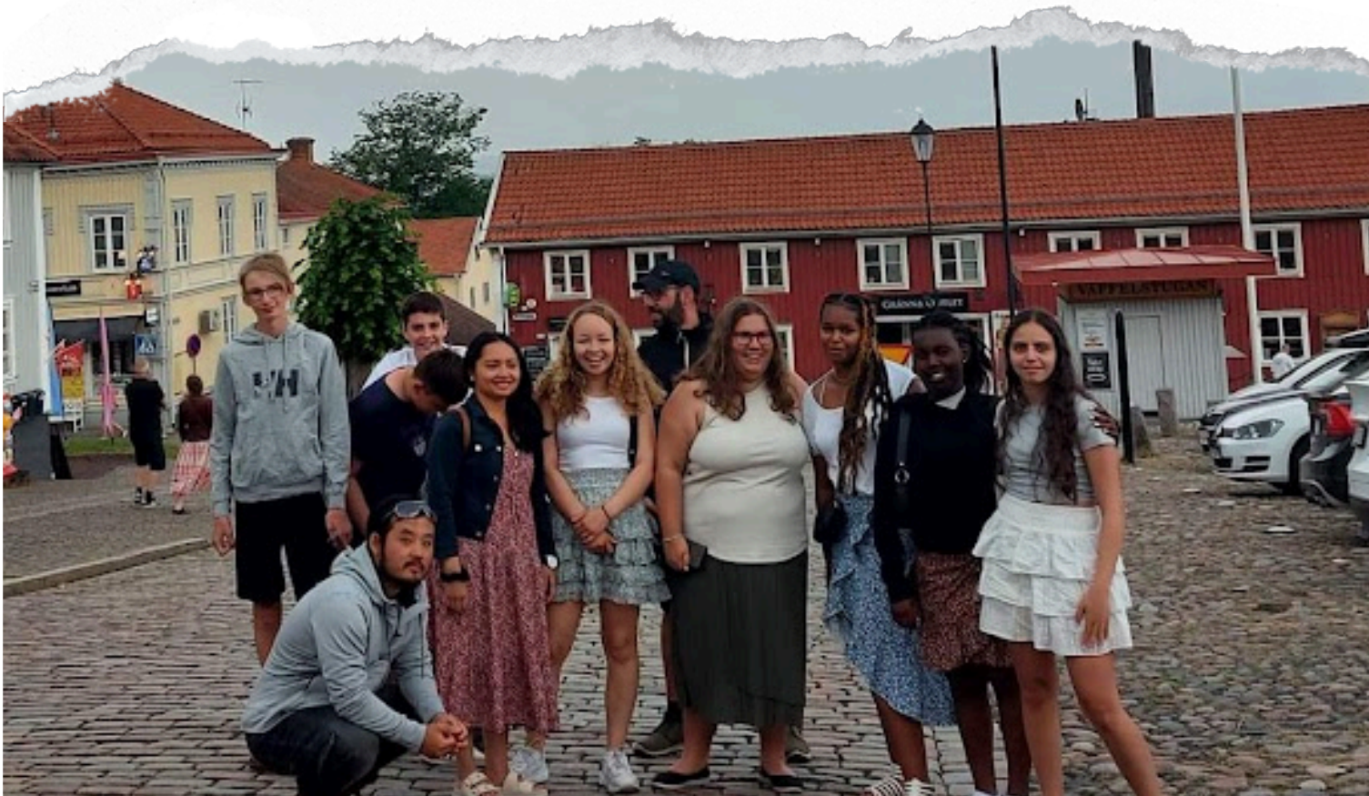
Bild 3. Från tonårsresan till Malmö.